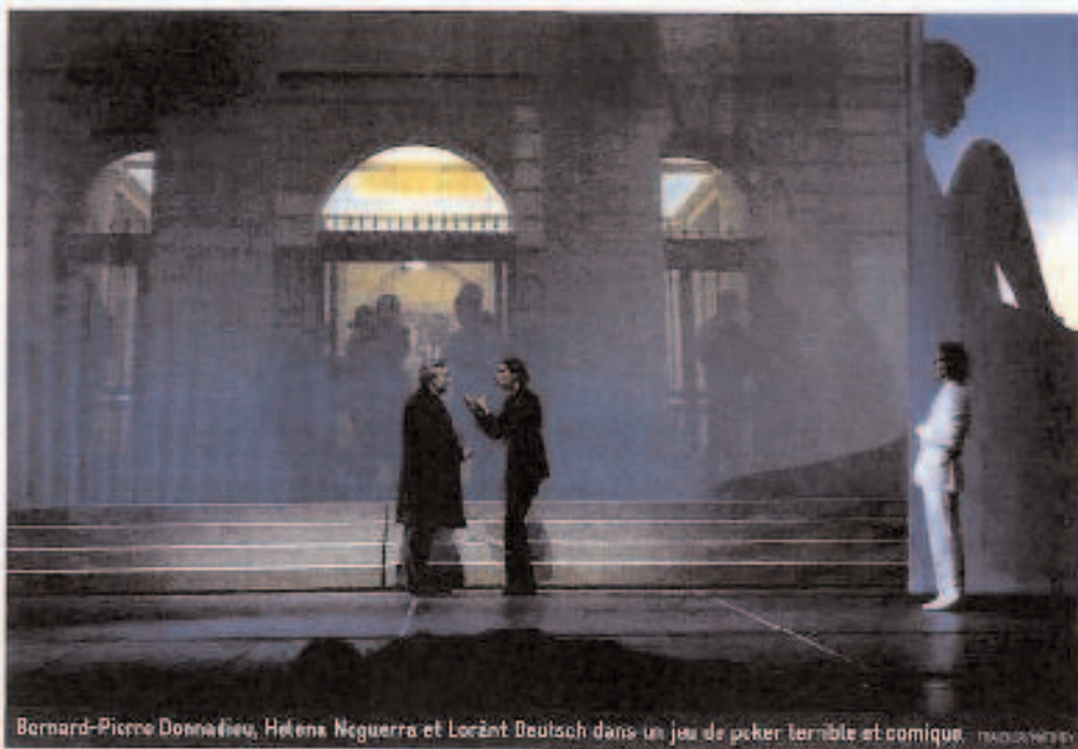
Bernard-Pierre Donnadieu, Helena Noguerra et Loránt Deutsch dans un jeu de poker terrible et comique.